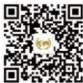
世界酒店联盟官方微信 微信名：WHA 微信号：worldhotel-2014