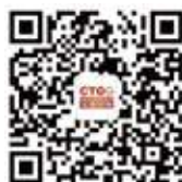
世界酒店联盟官方微信 微信名：文旅国际传媒 微信号：worldwidehotel