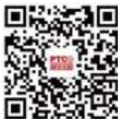
世界酒店联盟官方微信 微信名：泛旅文化集团 微信号：worldhotel-2016